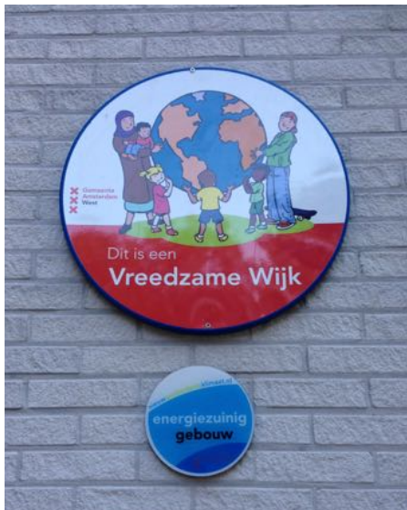
Westerparkschool Gevelbord en mozaïek op het van Hogendorpplein