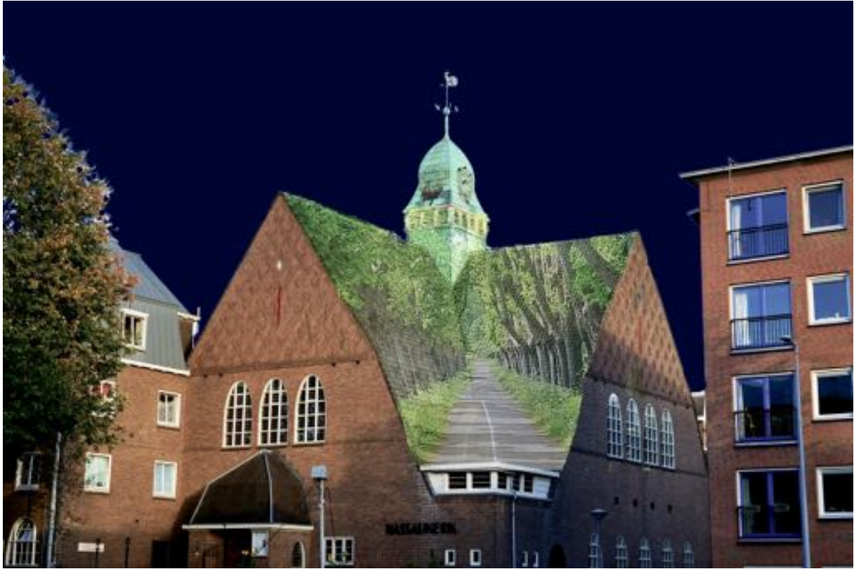
Tanja Henn: Buurtlicht projectie op de Nassaukerk i.v.m. Gaandeweg